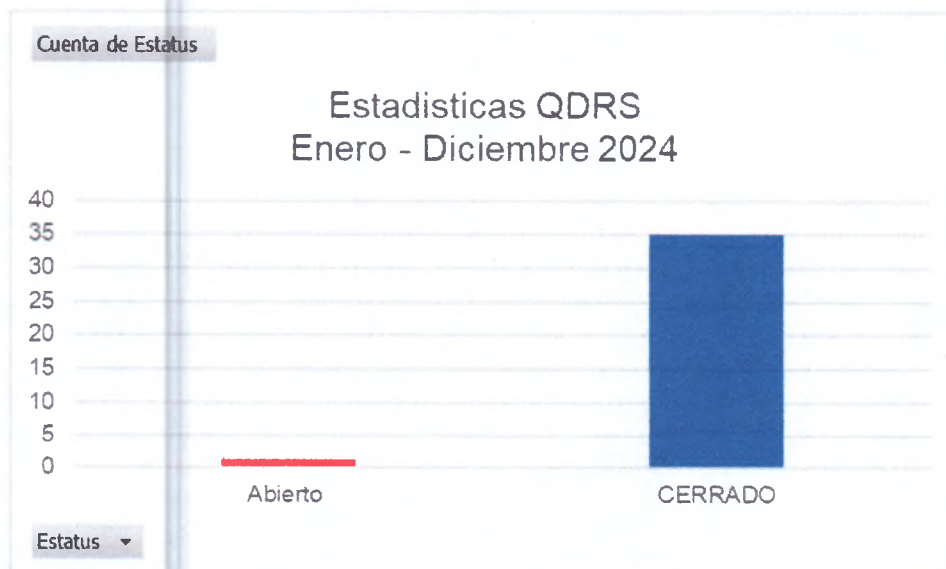
Gráfico No. 2: